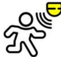
0-10 Atenuación Sensor de Movimiento