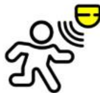
0-10 Atenuación Sensor de Movimiento